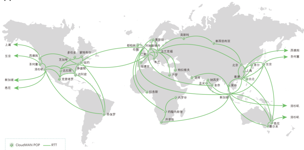
AppEx CloudWAN 全球 POP 节点及骨干网络示意图

AppEx CloudWAN 已在全球基于公有云平台搭建了一张巨型网络，目标是无死角覆盖全球，并且可以根据企业分支需求快速开通 POP 节点，帮助企业 anywhere、anytime